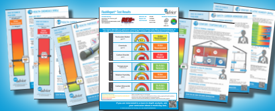
FlashReport de 30 MINUTES