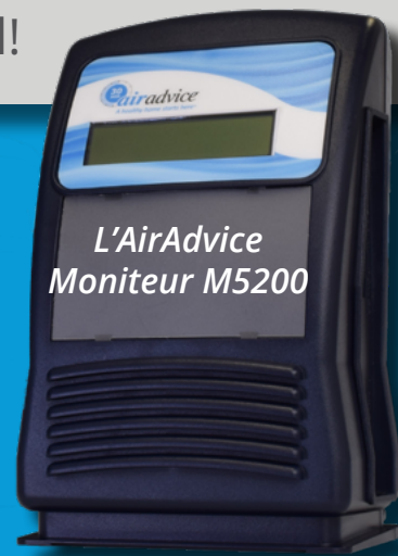
L'AirAdvice Moniteur M5200